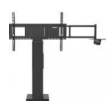
VB-STND-004 Elektrisch höhenverstellbarer Bodenstandfuß EAN 76690798341 8