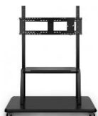
VB-STND-001 Rollwagen EAN 76690794761 8