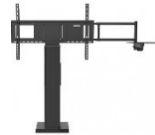
VB-STND-004 Elektrisch höhenverstellbarer Bodenstandfuß EAN 76690798341 8