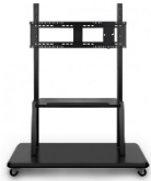
VB-STND-001 Rollwagen EAN 76690794761 8